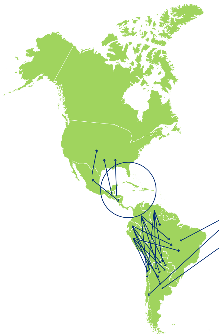
Figura 1 | Flujos migratorios del Caribe, Centroamérica y Suramérica