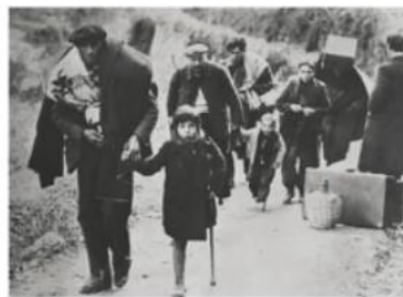
Refugiados en la frontera francesa

Nota. Captura de pantalla de Geografía e Historia de 4º de ESO Revuela , SM (2023), p. 104.