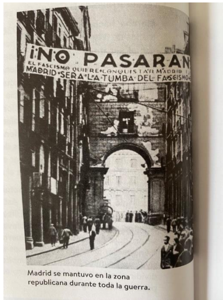
Figura 2. La resistencia de Madrid

Nota. Fotografía de Geografía e Historia 4 ESO , Oxford (2023), p. 80