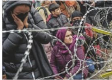
Figura 4. Refugiados presentes y pasados en el libro de SM

corresponsal en la guerra de Ucrania en 2022 (p. 100) y una de refugiados actuales en la parte que trata las consecuencias de la Guerra Civil (véase figura 4).