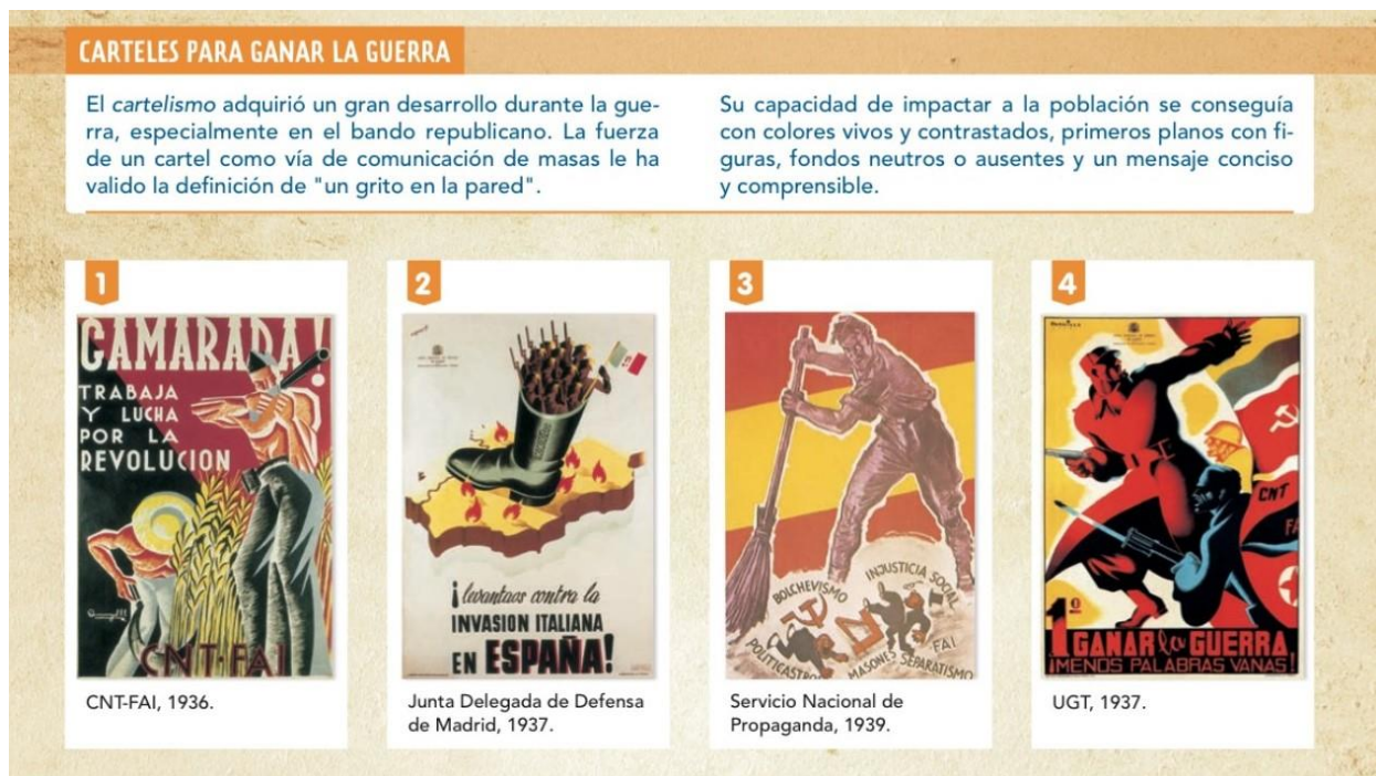
Figura 5. Carteles propagandísticos en el libro de texto de Vicens Vives

Nota. Captura de pantalla de En Red Geografía e Historia 4º ESO , Vicens Vives (2021), p. 151.