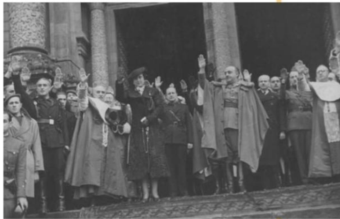
Figura 3. Francisco Franco con miembros de la Iglesia, el Ejército y la Falange, Santiago de Compostela 1938.

Nota. Captura de pantalla de En Red Geografía e Historia 4º ESO , Vicens Vives (2021), p. 148.