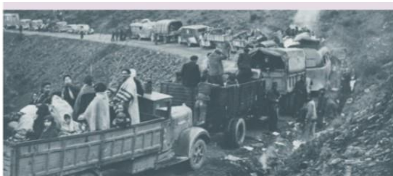
Figura 1. Exiliados cruzando los pirineos catalanes hacia Francia

Nota. Captura de pantalla de En Red Geografía e Historia 4º ESO , Vicens Vives (2021), p.