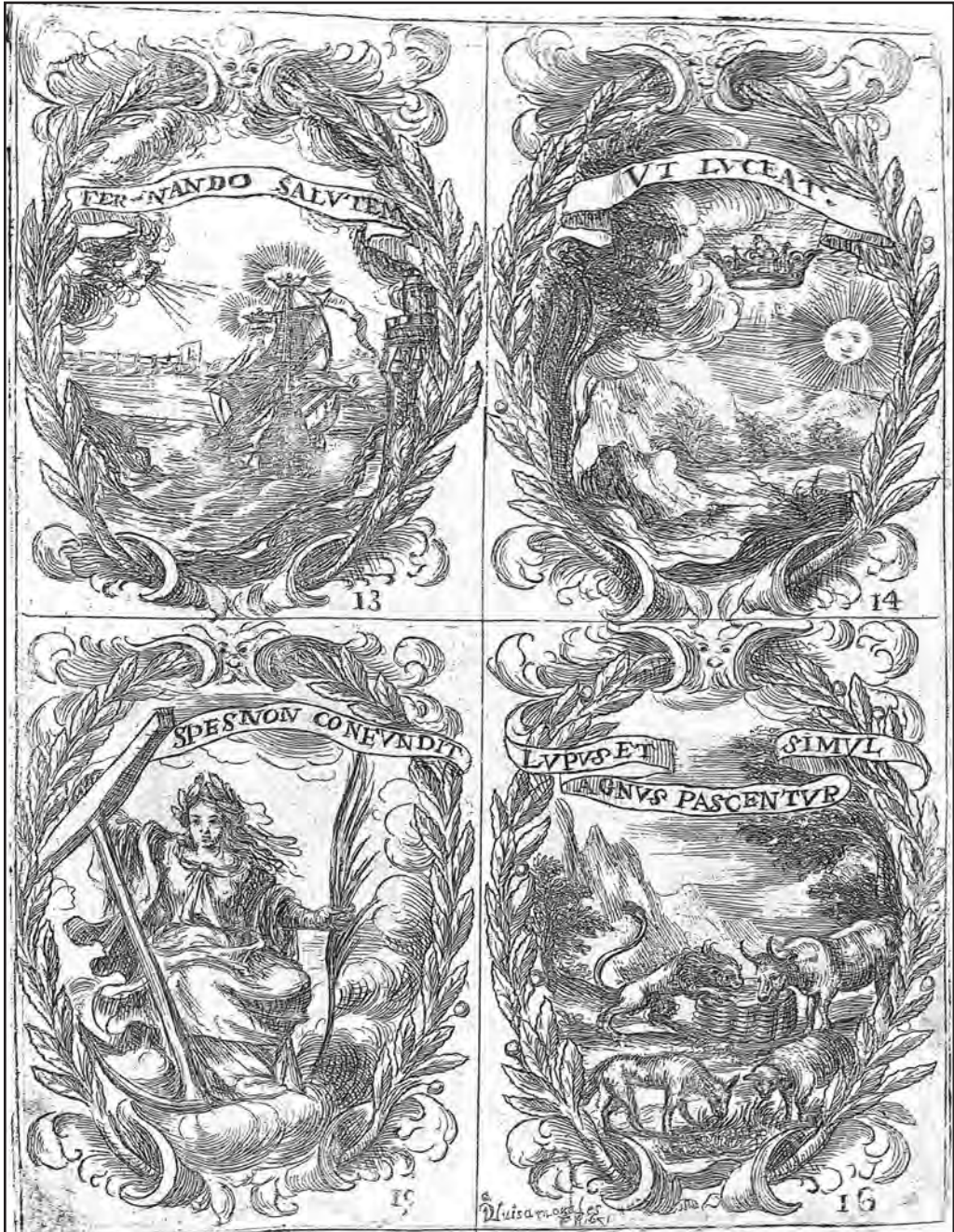
Fig. 1B. Luisa Morales. Emblemas 9-16, estampas del libro de Torre Farfán, F. Fiestas de la S. Iglesia Metropolitana y Patriarcal de Sevilla, al nuevo culto del rey S. Fernando el tercero de Castilla , 1ª Ed. Sevilla, Viuda de Nicolás Rodríguez, 1672.