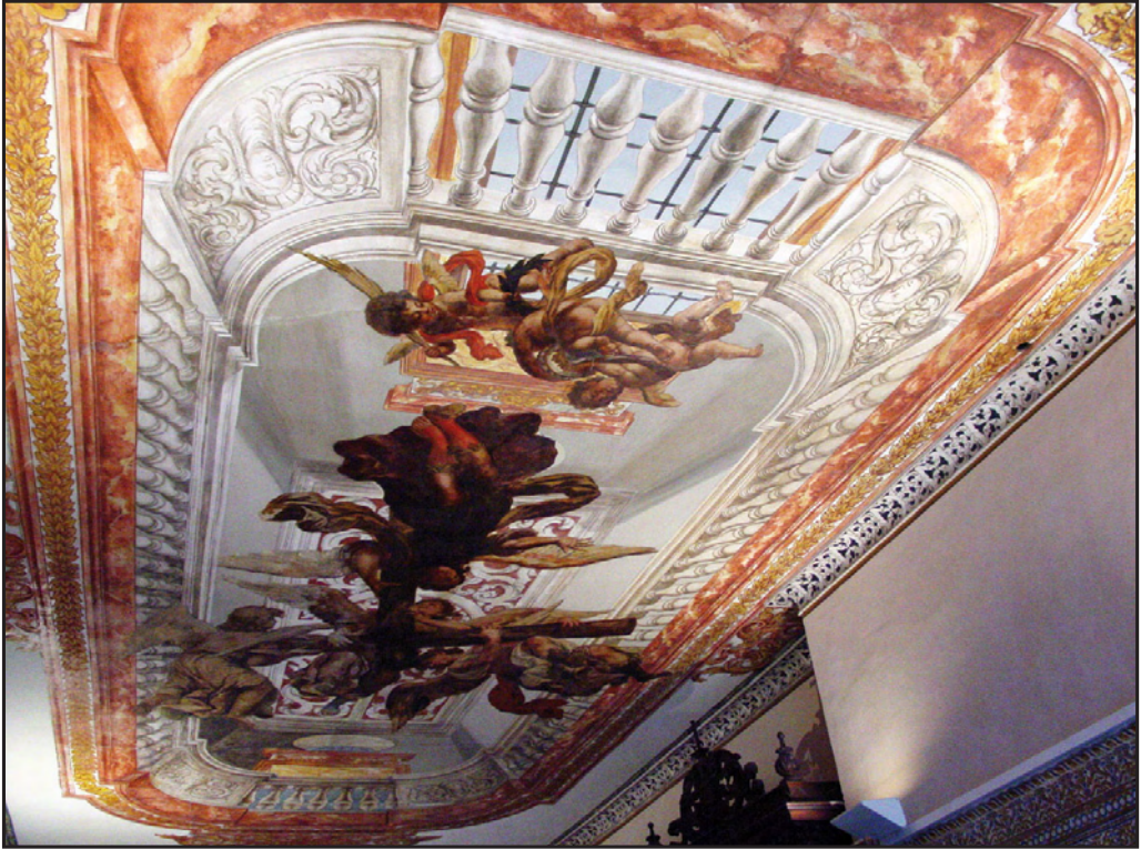
Fig. 3. Juan Valdés Leal y Lucas Valdés, iglesia del Hospital de los Venerables Sacerdotes. Temple y óleo (Sevilla, 1684-1688)