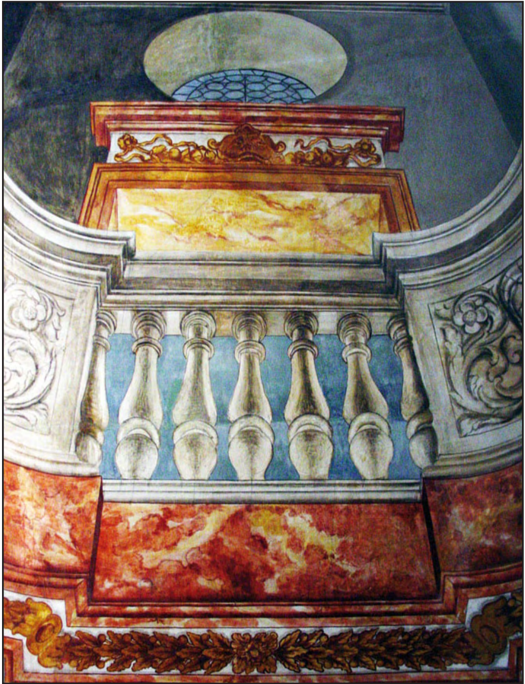
Fig. 5. Juan Valdés Leal y Lucas Valdés, iglesia del Hospital de los Venerables Sacerdotes. Temple y óleo (Sevilla, 1684-1688)