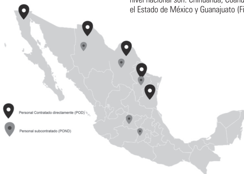
Figura 2. Personal ocupado y condición de contratación por entidad federativa. Primer trimestre 2018

A pesar de los montos a pagar por concepto de término de contrato, la subcontratación como herramienta de flexibilidad laboral ha ido creciendo a nivel nacional, pues en el 2003 el POND representaba 8.6% del total del personal, pasando a 13.6% en el 2008, y 16.6% en el 2013, donde la industria manufacturera tiene el mayor personal subcontratado. Encontrando que los estados con más personal laborando bajo este esquema de contratación en dicha industria, a nivel nacional son: Chihuahua, Coahuila, Nuevo León, el Estado de México y Guanajuato (Figura 2).