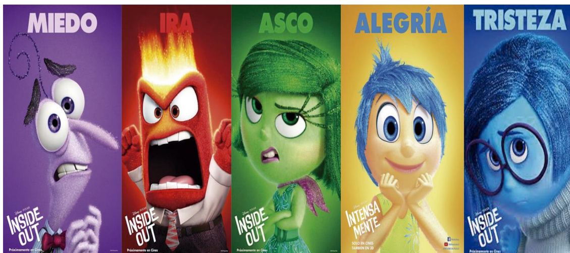
Figura 3. Imágenes de emociones; Adaptadas de “Del revés ( Inside Out ): mi opinión”, por Elena, 22 de julio de 2015, Aula de Elena.