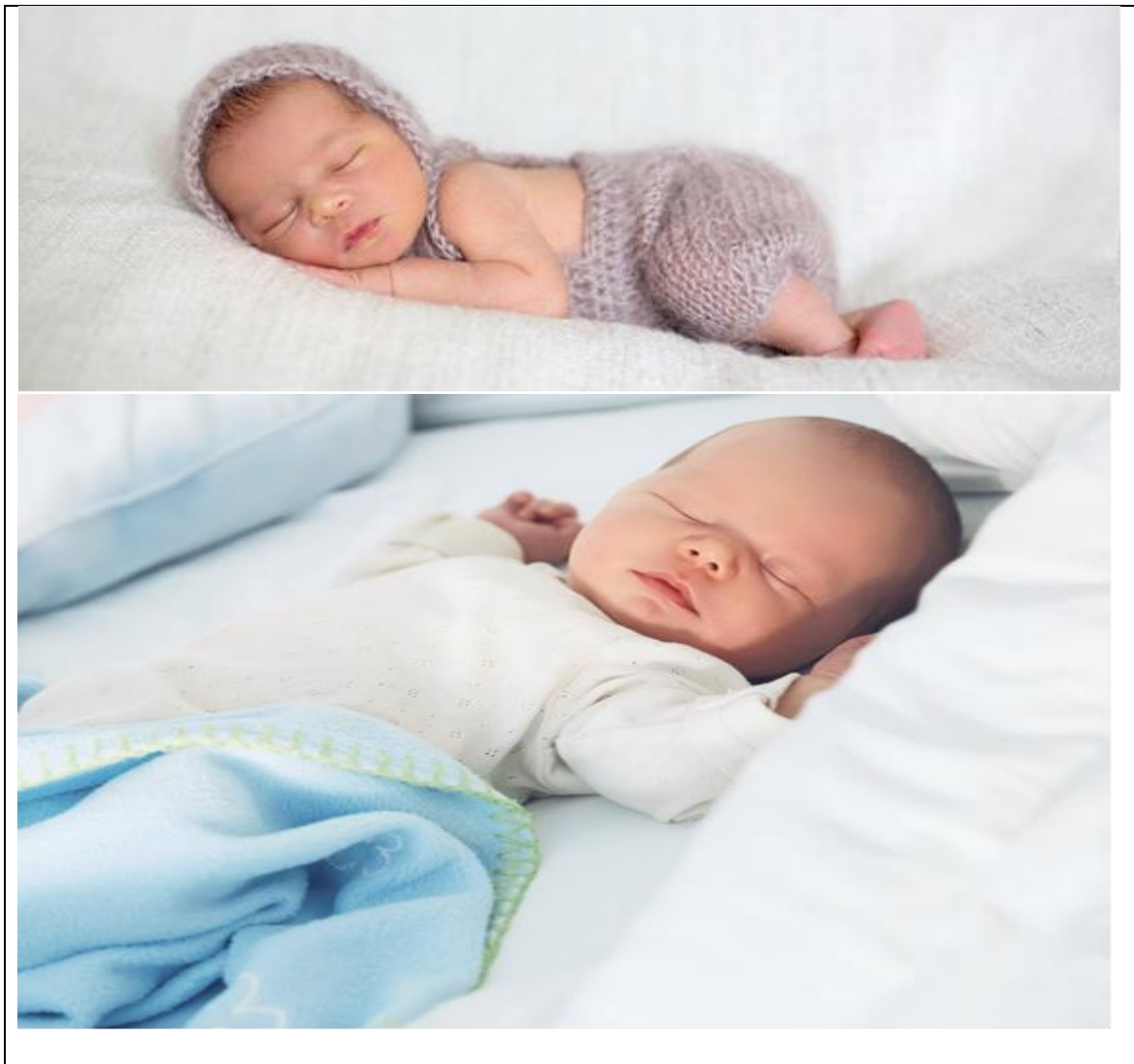
Figura 1. Imágenes de bebé; Adaptada de “El recién nacido con bajo peso”, por M. Campos, s.f., Guía del Niño ; Adaptada de “Cómo debe de dormir el bebé recién nacido para evitar la muerte súbita”, por V. Vicente, 2018, Guía Infantil .